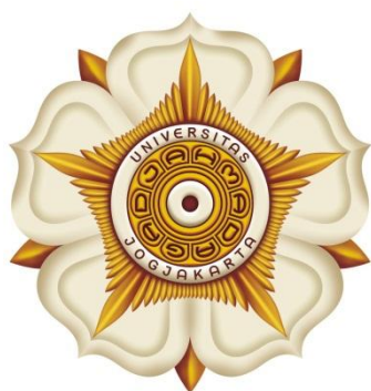
Gb. 1. Lambang 3 (Tiga) Dimensi

Pada awal mulanya, Lambang Universitas Gadjah Mada diwujudkan dalam kalung jabatan Presiden Universitas, Sekretaris Senat, dan Ketua Fakultas. Selanjutnya juga diwujudkan dalam warna-warna dari universitas, dalam vandel dan dalam Tongkat Staf pedel.